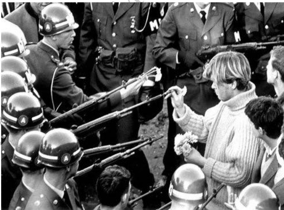
Photo du journaliste Bernie Boston, 21 octobre 1967, à Washington, lors d'une «marche vers le Pentagone» contre la guerre du Vietnam.

Source : http://contestationvietnam-lit-so.eklablog.com/les-slogans-c24848500