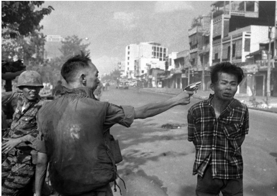
Photo d'Eddie Adams/AP, 1968 montrant le général sud-vietnamien Nguyen Ngoc Loan, chef de la police nationale, tuant d'une balle dans la tête un militant du Viêt-Cong.

Source : http://www.wbur.org/hereandnow/2017/03/31/vietnam-war-photos-associated-press