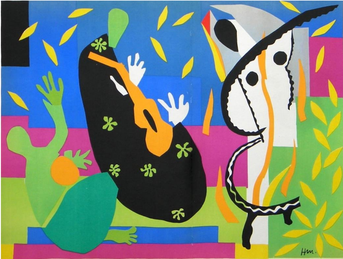
Henri Matisse, La tristesse du roi, 1952

Dans cet autoportrait de vieillesse, l'artiste se représente par cette forme noire et entouré des joies qu'il a éprouvées pendant sa vie.